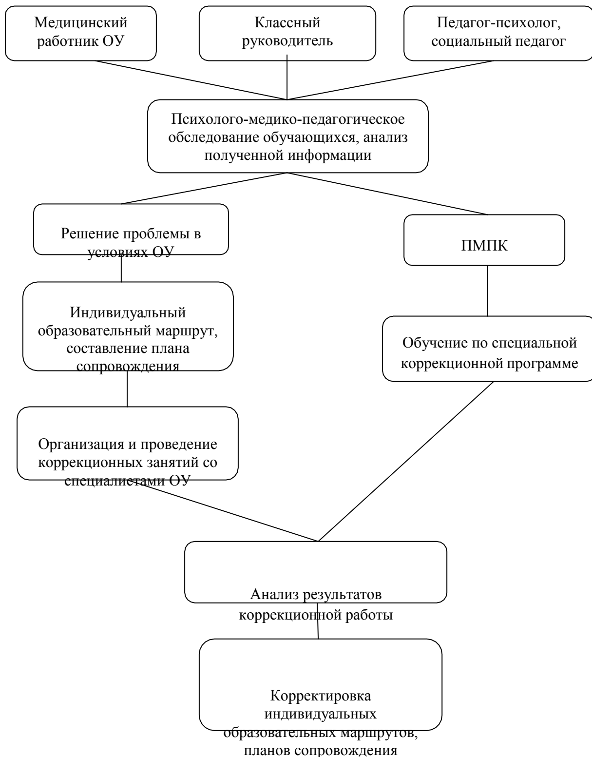
Схема № 1 «Система комплексного психолого-медико-педагогического сопровождения детей с ограниченными возможностями здоровья»